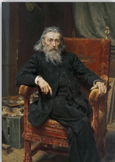
Jan Matejko, "Autoportret", 1892,