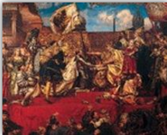
Jan Matejko, "Hołd pruski", 1879-1882

Malarstwo Jana Matejki pełne jest patosu i emocji, a zarazem przenika je myśl historiozoficzna. Obrazy, takie jak "Unia lubelska" (1869), "Stefan Batory pod Pskowem" (1872), "Bitwa pod Grunwaldem" (1878), "Hołd pruski" (1882), "Jan Sobieski pod Wiedniem" (1883), "Wernyhora" (1884), "Kościuszko pod Raławicami" (1888) czy "Konstytucja 3 Maja 1791 roku" (1891), to panoramiczne, wielopostaciowe kompozycje, na których drobiazgowo odwzorowane zostały historyczne realia - stroje, sprzęty czy detale architektoniczne. Siłą dzieł Matejki stanowi jednak rozgrywająca się na pierwszym planie akcja. Jej dramaturgia tkwi w psychologicznej głębi postaci, ich wyrazistej ekspresji odzwierciedlającej sens dziejowych przemian. Artysta nie starał się przedstawiać ściśle prawdy historycznej, np. wprowadzał do swoich obrazów osoby, które były powiązane z danymi wydarzeniami, ale w nich nie uczestniczyły.