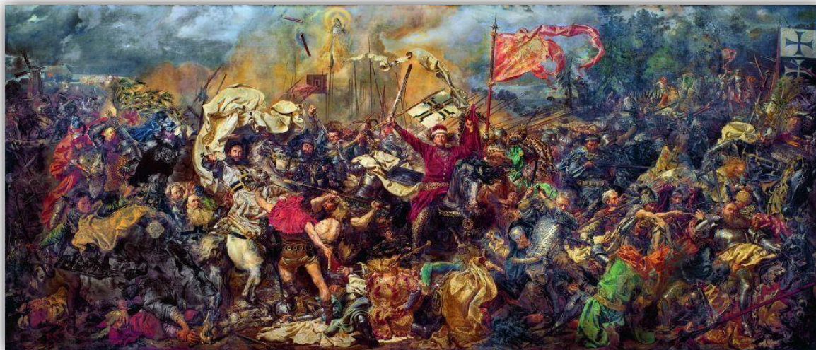
Jan Matejko, "Bitwa pod Grunwaldem", 1878,

Malarstwo Jana Matejki pełne jest patosu i emocji, a zarazem przenika je myśl historiozoficzna. Obrazy, takie jak "Unia lubelska" (1869), "Stefan Batory pod Pskowem" (1872), "Bitwa pod Grunwaldem" (1878), "Hołd pruski" (1882), "Jan Sobieski pod Wiedniem" (1883), "Wernyhora" (1884), "Kościuszko pod Raławicami" (1888) czy "Konstytucja 3 Maja 1791 roku" (1891), to panoramiczne, wielopostaciowe kompozycje, na których drobiazgowo odwzorowane zostały historyczne realia - stroje, sprzęty czy detale architektoniczne. Siłą dzieł Matejki stanowi jednak rozgrywająca się na pierwszym planie akcja. Jej dramaturgia tkwi w psychologicznej głębi postaci, ich wyrazistej ekspresji odzwierciedlającej sens dziejowych przemian. Artysta nie starał się przedstawiać ściśle prawdy historycznej, np. wprowadzał do swoich obrazów osoby, które były powiązane z danymi wydarzeniami, ale w nich nie uczestniczyły.