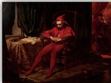
Jan Matejko, "Stańczyk", 1862,